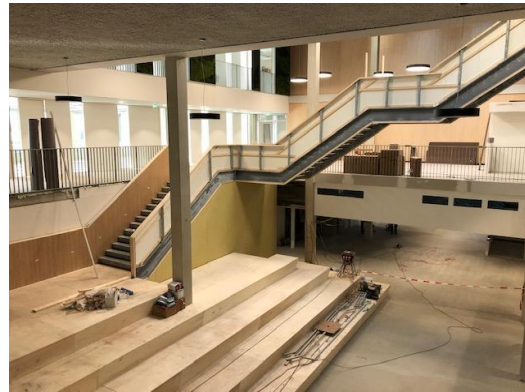
De trap is een blikvanger in het gebouw