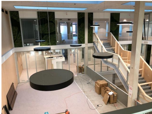
De grote hal