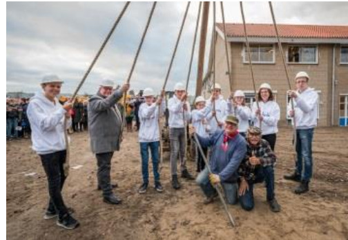
De aftrap voor de bouw in november 2019

Het is nog maar een jaar geleden dat de eerste paal van de Beroepscampus de grond in ging. Wat een werk is er in een jaar verzet! Deze maand is het al zover dat de bouwer het pand kan overdragen. Dan is fase 1 klaar, waarna fase 2 van de nieuwbouw snel zal volgen.