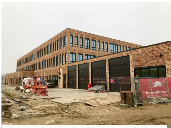
Iedere voorbijganger heeft kunnen zien hoe het gebouw zijn uiteindelijke vorm kreeg